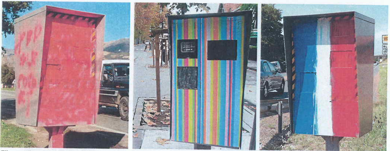
Ceil pour œil. Vandalisé en Corse, décoré à Toulouse, dégradé à Blanzly, les radars (en service ou non) sont au nombre de 2 374.