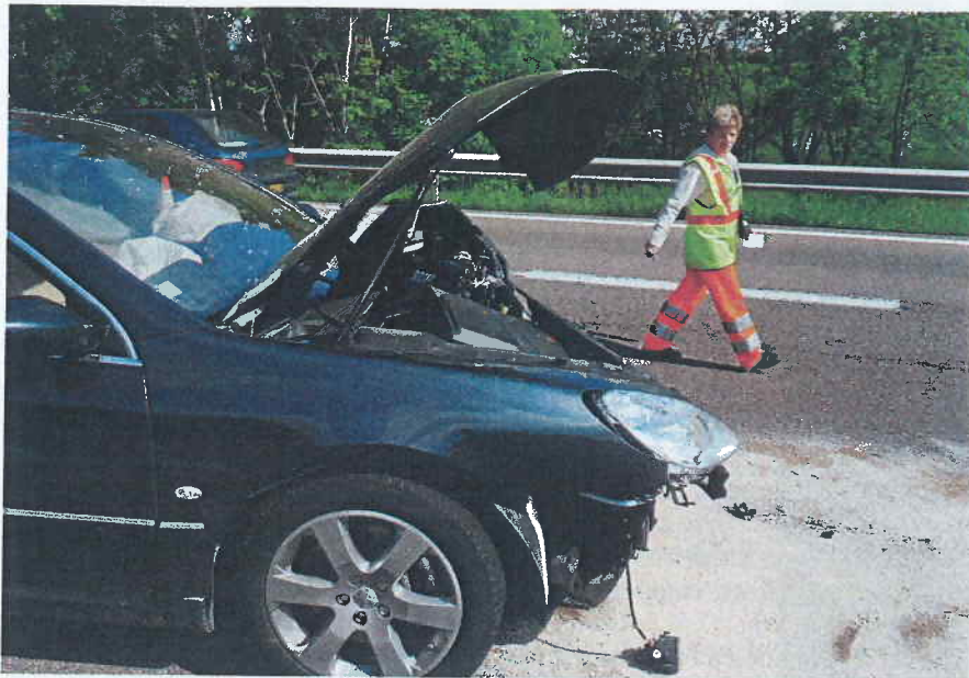
Danger. En cas d'accident, l'assureur du sans-permis déclare forfait.